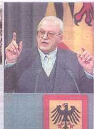
RÜCK-REDE Roman Herzog bei seiner „Berliner Rede“ 1997. Damals sprach er den legendären Satz: „Durch Deutschland muß ein Ruck gehen!“