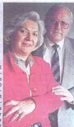
ERSTE EHE Mit der verstorbenen Christiane Herzog († 63) war der Alt-Bundespräsident 41 Jahre verheiratet. In Herzogs Arbeitszimmer steht ein Foto von ihr