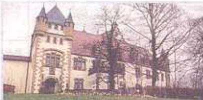
FAMILIENSITZ Alt-Bundespräsident Roman Herzog wohnt heute auf der Götzenburg, einer berühmten Raubritterburg. Hier lebte von 1480 bis Mitte des 16. Jahrhunderts Götz von Berlichingen, der berühmte „Ritter mit der eisernen Hand“.